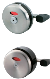
表示器付 ラッチ錠